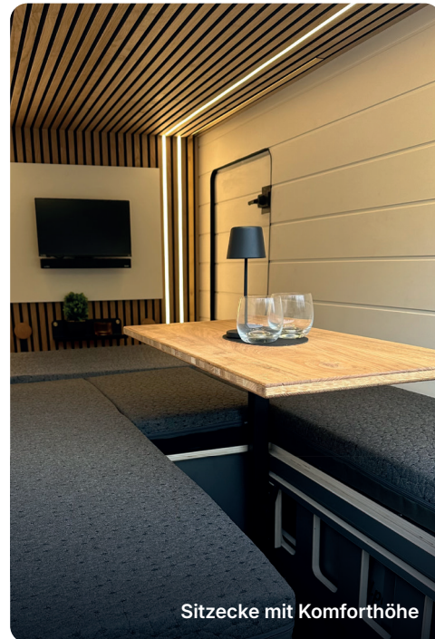
Sitzecke mit Komforthöhe