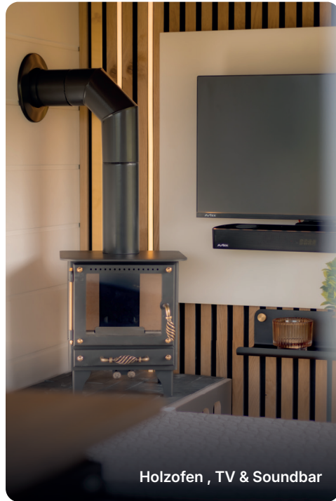
Holzofen , TV & Soundbar